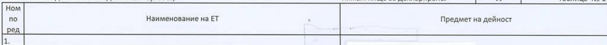
Таблица № 17