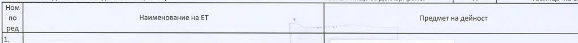
Таблица № 17