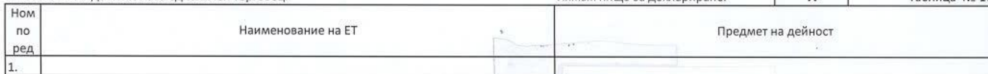
Таблица № 17