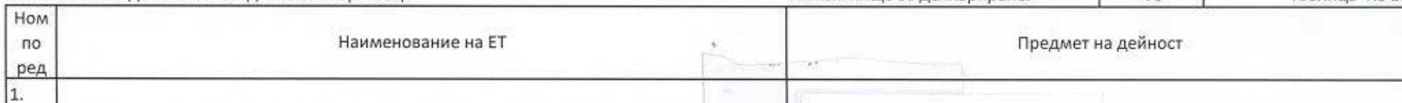
Таблица № 17